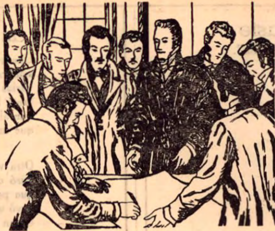
Firma de los Diputados