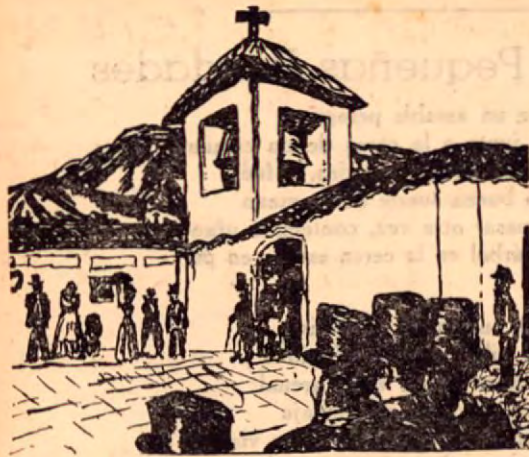
La antigua iglesia La Merced