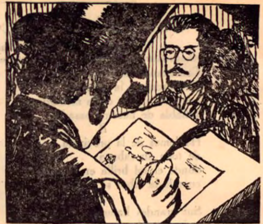
Firma del Protocolo

El primer Congreso Constitucional que tuvo Costa Rica, hoy Asamblea Legislativa, se instaló el 6 de setiembre de 1824, es decir, hace ciento treinta y cinco años, en la ciudad de San José, día designado con anticipación por el Decreto de 5 de mayo del mismo año.